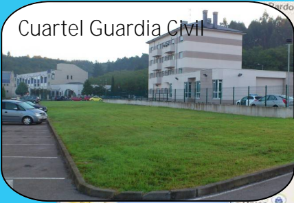
Cuartel Guardia Civil