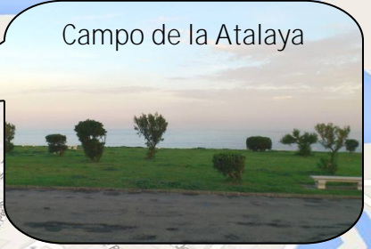
Campo de la Atalaya