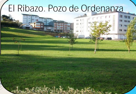
El Ribazo. Pozo de Ordenanza